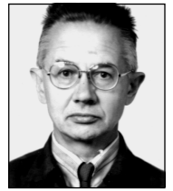
В. Г. Горшков , д.ф.-м.н., профессор, Петербургский институт ядерной физики РАН, г. Гатчина, Россия