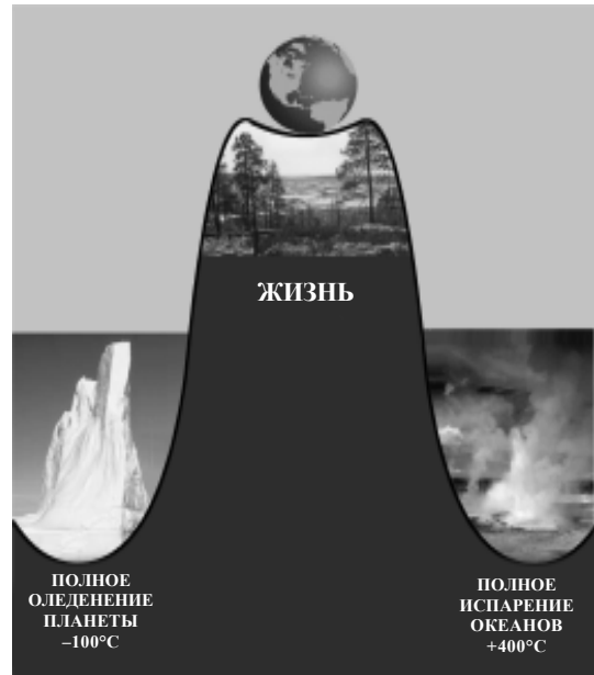
Рис. 2. Схематическое изображение потенциальной функции, описывающей устойчивость современного пригодного для жизни человека климата Земли. Минимум (ямка) потенциальной функции при +15^{\circ}\text{C} обеспечивается функционированием естественных экосистем Земли. Разрушение естественных экосистем в глобальном масштабе приведет к уничтожению этой ямки и скатыванию Земли в одно из двух непригодных для жизни состояний.

Как следует из вышеизложенного, огромное видовое разнообразие жизни и сложность взаимодействия особей различных биологических видов в их естественных сообществах обеспечивают поддержание пригодной для всей жизни окружающей среды. Не нарушенные человеком естественные сообщества и поддерживаемая ими окружающая их среда образуют экосистемы, которые представляют собой продукт миллиардов лет эволюции. Биотический механизм управления окружающей